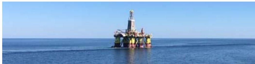
Третий день пути. Всего буровая преодолеет более 1300 км

18 июля полупогружная плавучая буровая установка (ППБУ) Nanhai VIII в составе буксировочного каравана покинула порт. Она будет доставлена в район архипелага Новая Земля из Кольского залива в сопровождении двух транспортно-буксирных судов, двух судов снабжения, двух пассажирских судов и одного аварийно-спасательного судна через Баренцево море. Здесь платформу встретит ледокол «Кигориак» с целью сопровождения в Карском море до точки бурения. Всего ППБУ преодолеет путь в 731 морскую милю (1354 км).