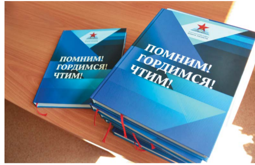
«ПОМНИМ! ГОРДИМСЯ! ЧТИМ!» Книга памяти издана при поддержке компании стр. 4