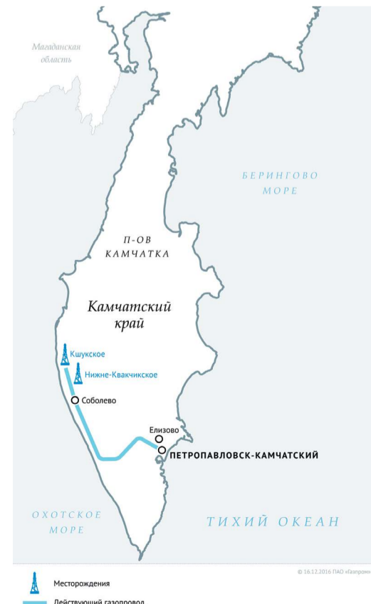
Месторождения Действующий газопровод