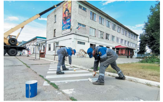
ВСЕ НА СУББОТНИК! Полезное мероприятие в честь выхода из карантина стр. 4