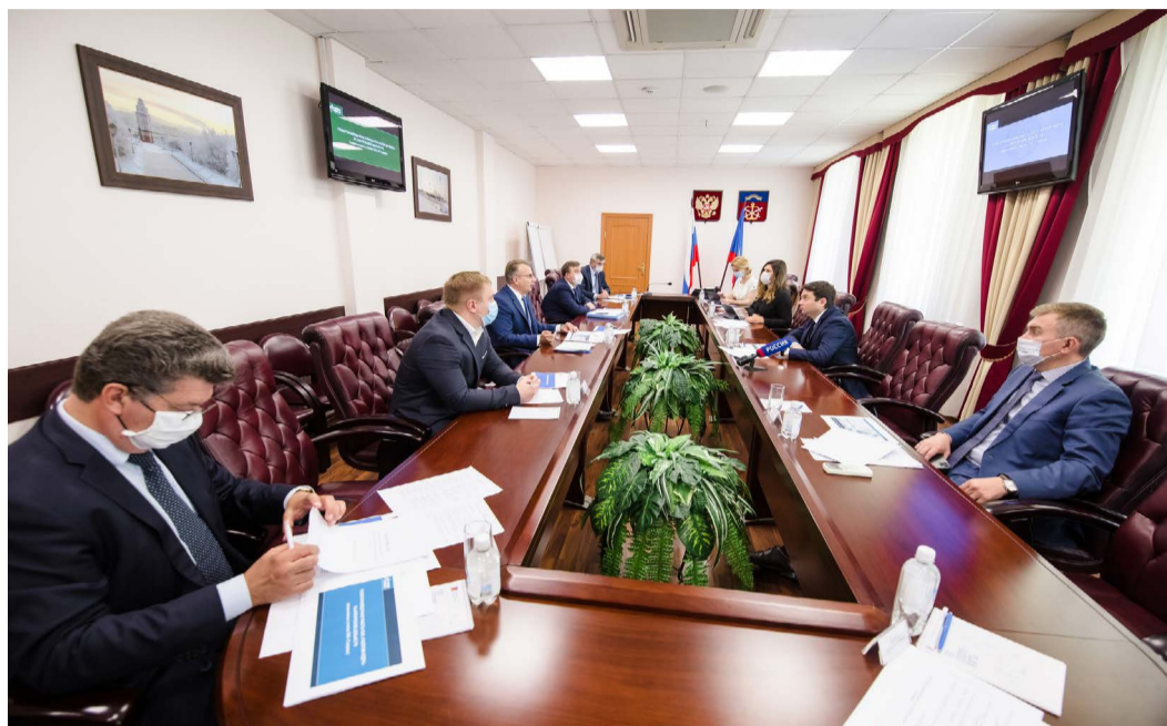
Рабочее совещание с участием представителей ООО «Газпром недра» и Правительства Мурманской области

Подписанный документ закрепил взаимную заинтересованность сторон в организации долгосрочного и эффективного сотрудничества по решению экономических, экологических и социальных задач в рамках комплексного развития Мурманской области.