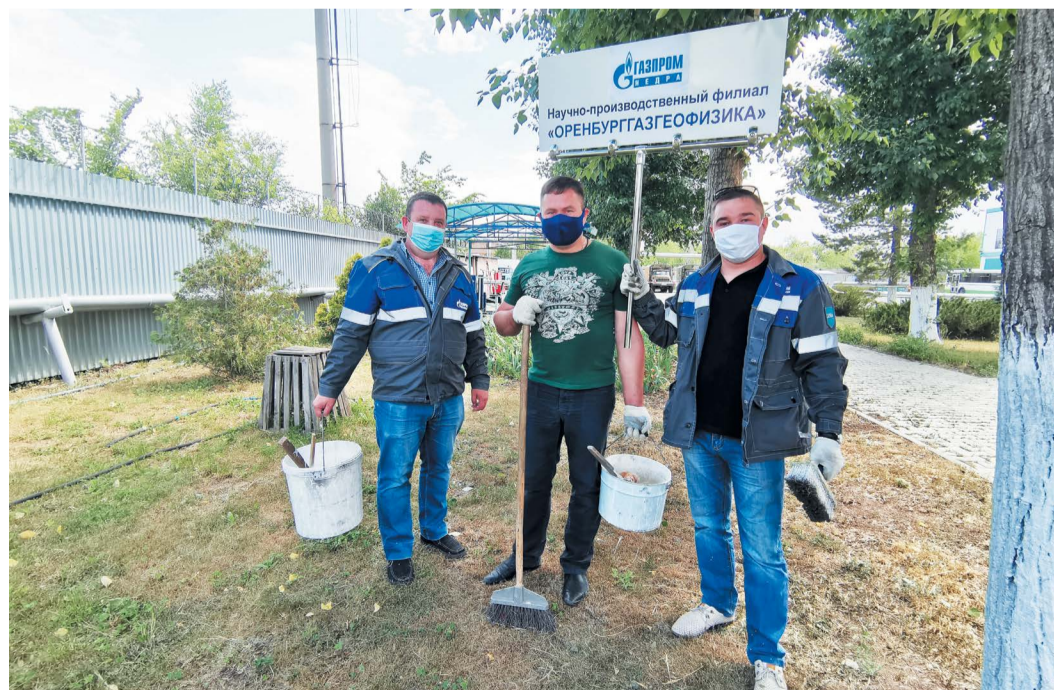
Важная составляющая успешного субботника – хорошее настроение