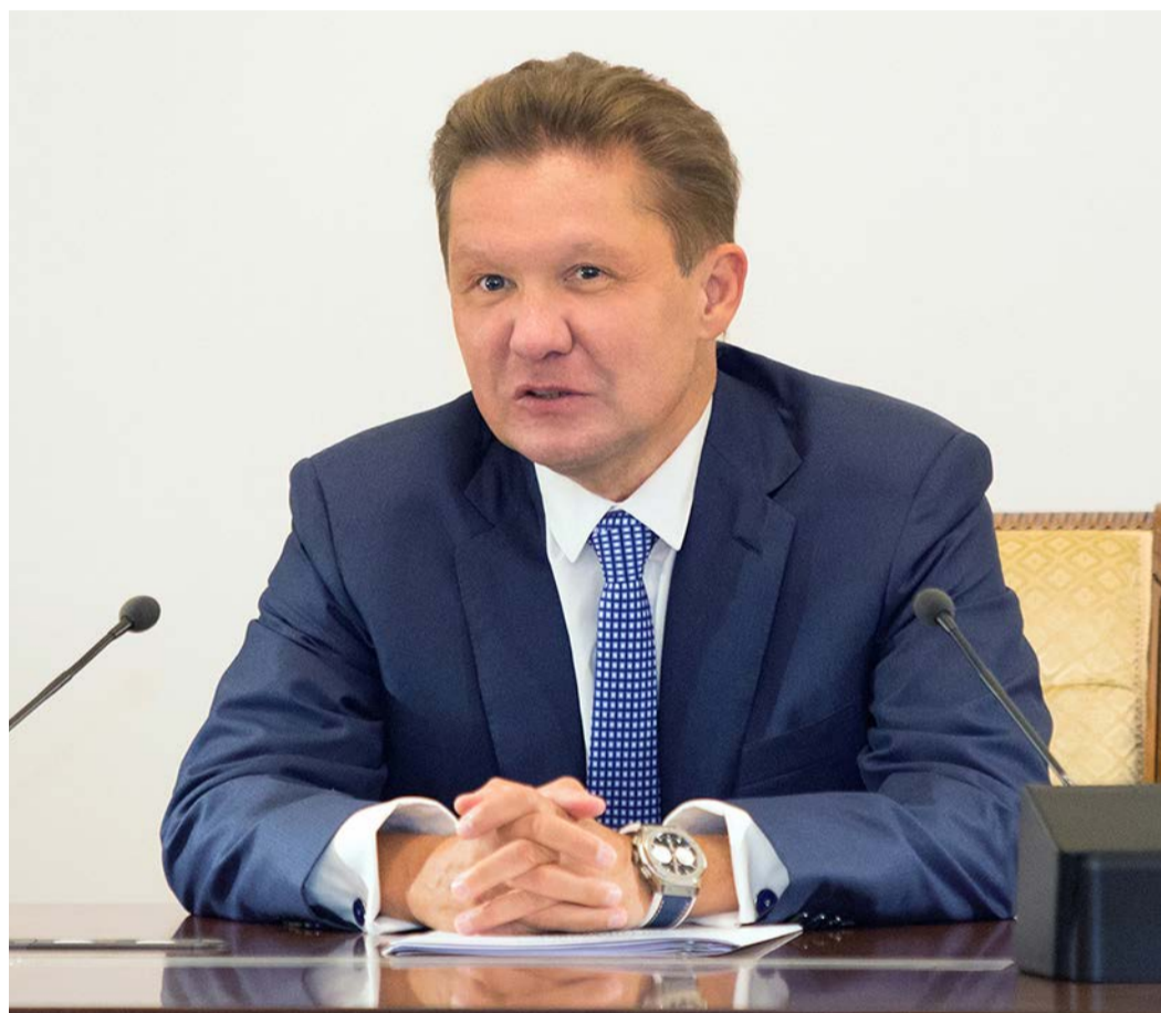
Председатель Правления ПАО «Газпром» А. Б. Миллер

Что касается работы на европейском рынке. Мы продолжаем надежно обеспечивать газом наших потребителей. Остаемся здесь крупнейшим экспортером. Сегодня газовый рынок переживает не самый простой период. Сложности испытывают все его участники, но мы имеем больший запас прочности. У «Газпрома» есть целый ряд существенных преимуществ. Это и богатая ресурсная база,