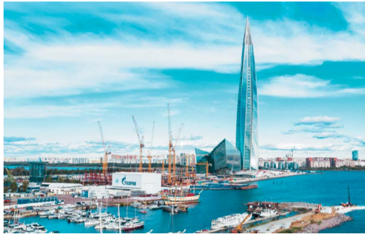
НАСЫЩЕННЫЙ ГОД Итоги собрания акционеров ПАО «Газпром» стр. 2