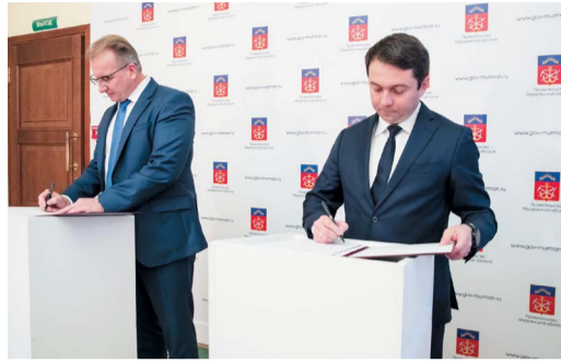
РАЗВИВАЕМ СОТРУДНИЧЕСТВО С РЕГИОНАМИ Подписано соглашение с Мурманской областью стр. 3